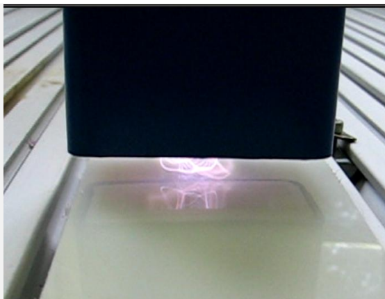
Úprava PP povrchu atmosférickou tryskou